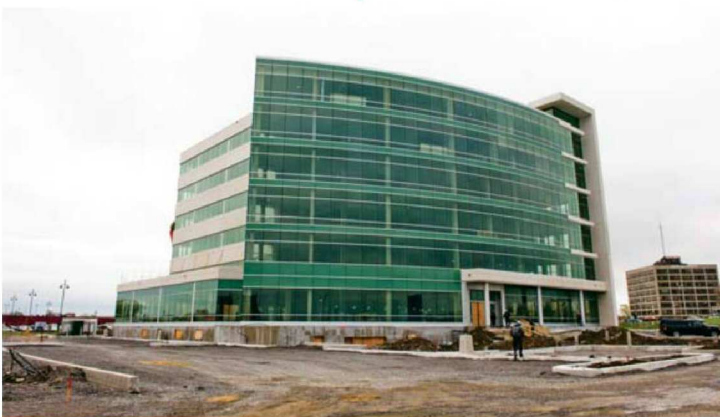
L'édifice de 6 étages comporte un garage souterrain de 50 places, et 65 % de la superficie de 112 000 pieds carrés est déjà louée.

Au début des années 80, le promoteur immobilier a rénové et agrandi un ancien immeuble du boulevard Décarie pour Communications Ericsson, puis il a développé et géré l'ensemble du campus d'entreprise d'Ericsson à Montréal, en plus d'y ajouter deux nouvelles tours de bureaux. Ce complexe d'un demi-million de pieds carrés a été acclamé pour la qualité de sa construction, son design exceptionnel, sa convivialité et son utilisation économique. « Nous avons commencé avec 7 000 pieds carrés pour Ericsson. Au fil des ans, nous avons évolué ensemble jusqu'à atteindre la superficie mentionnée de 500 000 pieds carrés. C'est une croissance rarement vue entre les mêmes locateur et locataire. »