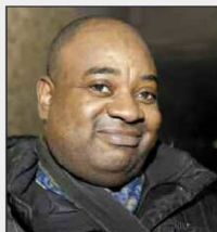
Tedika - Ahuntsic. Pas à 100%... (rires)