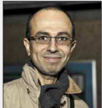
Ali - Montréal Est. Je ne crois pas forcément tout ce que racontent les journaux. Pour ce qui est de Montréal, je crois que non.

Si des villes de banlieue on fait la manchette avec des maires sur qui pèsent de lourds soupçons de corruption, on peut dire que jusqu'ici, l'administration montréalaise a été relativement épargnée. Qu'en pensez-vous ? Le syndrome de l'enveloppe brune a-t-il frappé la mairie de Gérald Tremblay ? Vous verrez que la confiance n'est pas au rendez-vous.