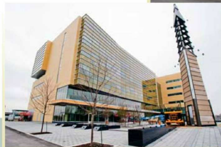
Le futur campus comprendra 23 classes multimédias, 22 classes pour les travaux de groupe, 4 amphithéâtres, une bibliothèque, une cafétéria, des laboratoires d'enseignement, une clinique d'enseignement ouverte au public, des bureaux pour les enseignants et un stationnement souterrain de 300 places.

Plusieurs concepts d'économie et de réutilisation de l'énergie ont été utilisés. C'est le cas notamment de l'entrée d'air pour la ventilation des stationnements. Elle est réutilisée pour les six étages afin d'économiser de l'énergie.