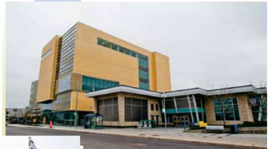
Érigé à quelques pieds de la station de métro Montmorency, le nouveau campus de 6 étages couvrira 20 500 mètres carrés et offrira toujours une vaste gamme de programmes en formation continue.

Un des plus gros défis a été la conception et l'installation d'un escalier monumental reliant le rez-de-chaussée au cinquième étage. « Il s'agit d'un étage suspendu qui constitue un élément central du bâtiment. Le défi était de tout coordonner. »