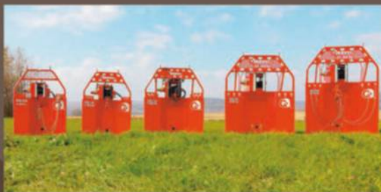
TREUILS HYDRAULIQUES RG