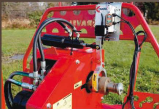
TÉLÉCOMMANDE SANS FILS

Garage S.M. Audet inc. Sainte-Claire comté Bellechasse, Qc Tél. : 418 883-3926