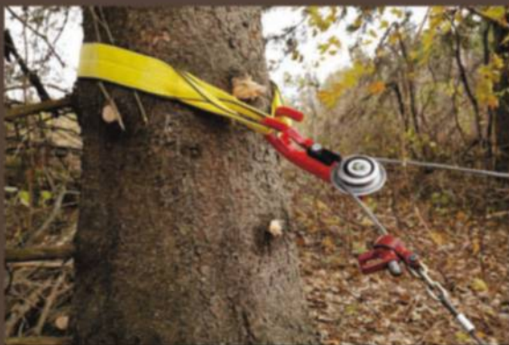
POULIE DÉVIATION AVEC ÉLINGUE EN NYLON