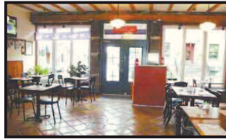
151, St-Paul Ouest [commercial] Bistro de 52 Places avec permis d'alcool, bonne location, rentable. 155,000 $