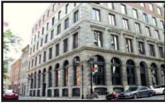
395, Rue Le Moyne [commercial] 4400 p.c. au r.d.c. et 4800 p.c. au sous-sol, Ancien emplacement de la « Cage aux Sports (tm) ».