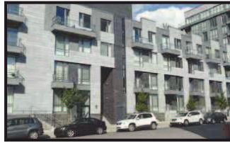
363, St-Hubert, # 306 Superbe unité de 1200 p.c., Projet SOLANO, au 3 e étage, 2 ch., balcons, garage intérieur.

François Laprade courtier immobilier agréé 514.608.9802