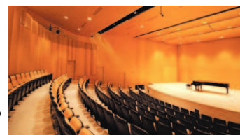
Conservatoire de musique et d'art dramatique de Montréal

«Nous n'avons pas commencé à la hâte l'an dernier parce que c'est devenu très actuel. Nous avons développé une expertise depuis longtemps», indique M. Topouzanov .