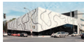
Centre Sportif Jean-Claude Malépart

Saia Barbarese Topouzanov architectes 339, rue Saint-Paul Est Montréal (Québec) H2Y 1H3 Tél.: 514-866-2085 http://www.sbt.qc.ca/