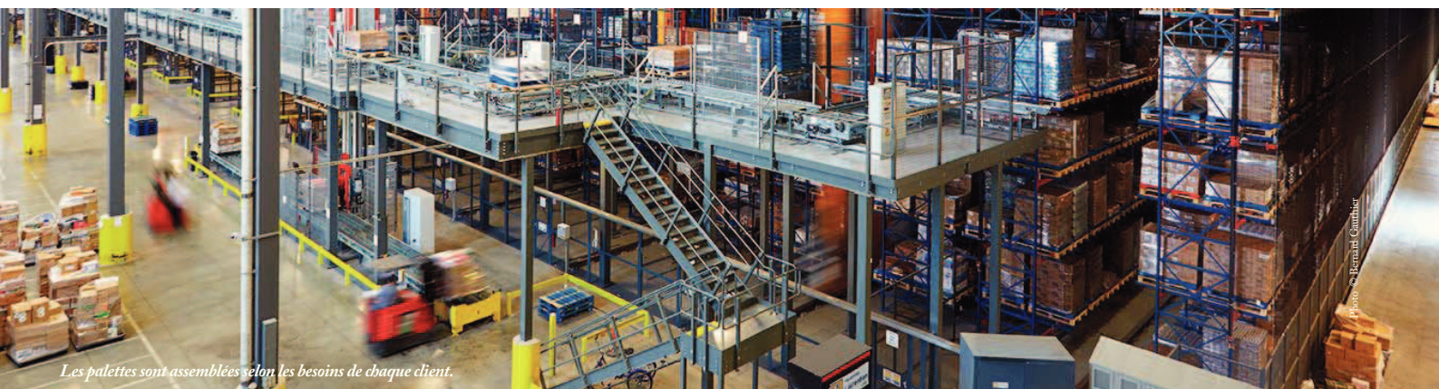
Les palettes sont assemblées selon les besoins de chaque client.

Munich en Allemagne. Spécialisée dans les systèmes de stockage et de préparation de commandes, Witron et Sobeys ont signé une entente exclusive de partenariat pour mettre sur pied et assurer la maintenance des équipements dans les centres de distribution.